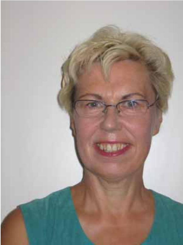
Sukujuhlan kuvaajana hääri Eila Huunan-Seppälä.